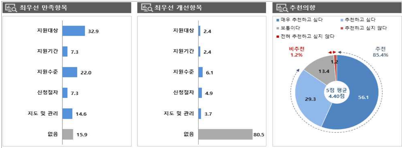
[그림 1] 해외인프라시장개척(전체) 만족/개선 항목 및 추천 의향